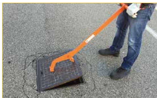
Nell'operazione di sollevamento la lunghezza della leva limita lo sforzo dell'operatore.