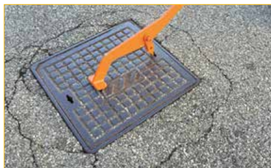
Inserimento del dente nell'asola e rotazione di 90°.