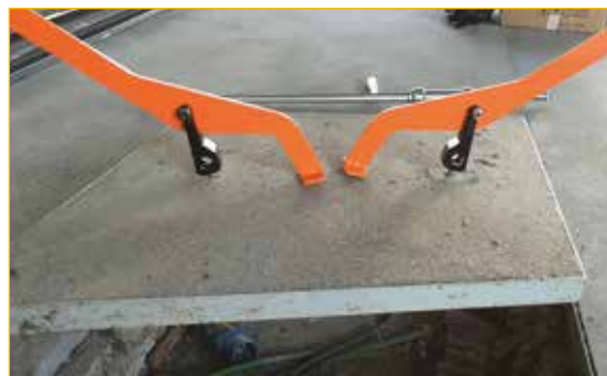
Utilizzo a due utensili per coperchi molto grandi.