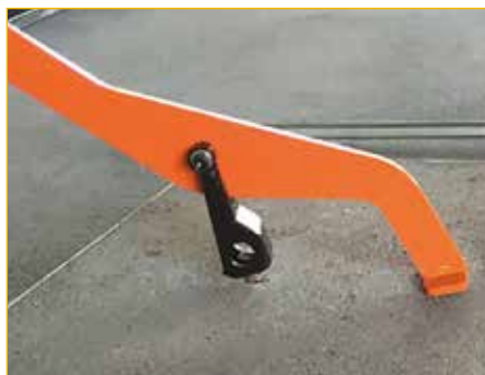
Possibilità di realizzare agganci secondo specifiche necessità.